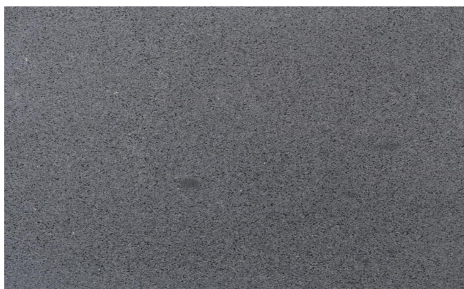
Foto is enkel indicatief, kleur- en structuraafwijkingen zijn mogelijk.

kleurnuances, zelfs binnen eenzelfde partij, kunnen voorkomen.